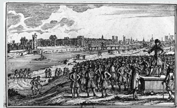
AVIS QUE DONNE UN PROUDEUR AUX PARISIENS QUIL EXORTE DE SE REVOLTER CONTRE LA TYRANNIE DU CARDINAL MAZARIN