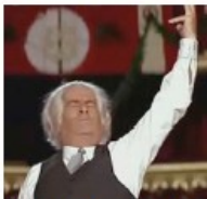
Louis De funès

d'une manière ou d'une autre par le geste. Le chef d'orchestre ne néglige pas pour autant son expression faciale, qui pourra indiquer des subtilités supplémentaires : caractère du mouvement, nuance ou ambiance générale de l'œuvre.