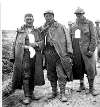
Un poste de secours à ciel ouvert, dans la boue Soldats triés avec une fiche d'évacuation