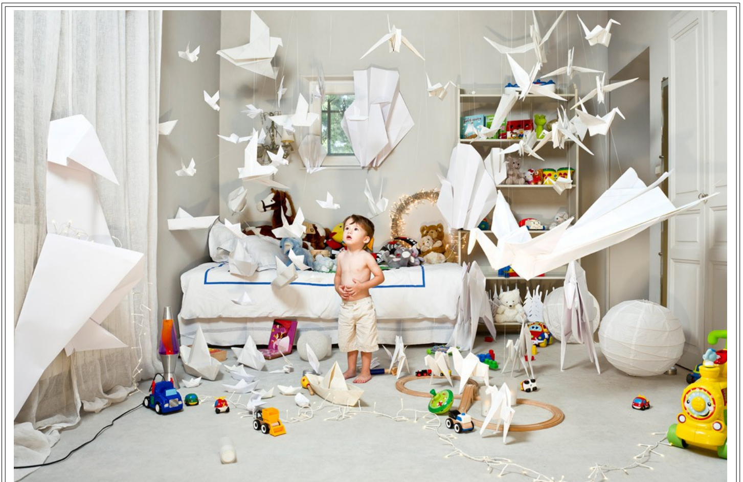
Cerise DOUCEDE « Série égarements » - 2010 - photographie 70 X 120 cm Collection de l'artiste

A vous de jouer en nous proposant une autre vision de votre lit, un moyen de locomotion imaginaire vers un voyage dont vous seul connaissez ou rêvez la possible destination en nous proposant une image l'évoquant.