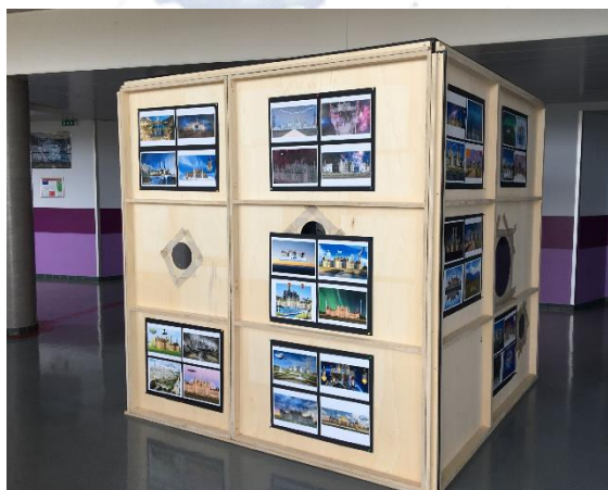
UN ESPACE MODUBABLE, CLG CARNE DE VINEUIL (LOIRE-ET-CHER)