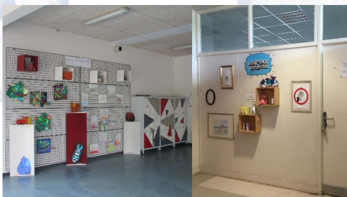
UN ESPACE DE PASSAGE, CLG. PAGNOL DE VERNOUILLET (EURE-ET-LOIR)

C'est un espace d'exposition identifié et défini comme tel (aménagements de locaux dans et/ou hors la classe ), qui présente sur un (angle de) mur, des présentoirs, etc. des travaux plastiques/artistiques d'élèves. Un espace annexe pensé, développé et utilisé par le professeur permettant la réalisation de certaines composantes de l'enseignement usuel : mise en « regard » des productions des élèves dans le cadre du projet d'enseignement et le travail sur les compétences du programme.