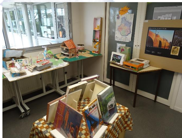
UN SAS ENTRE COUR ET CDI, CLG C. FREINET, STE-MAURE-DE-TOURAINNE (INDRE-ET-LOIRE)