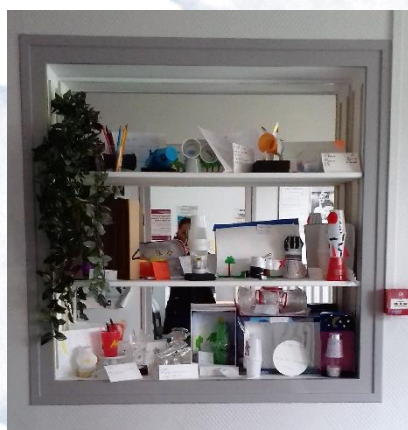
APPROPRIATION DU MOBILIER, CLG CONDORCET DE LEVROUX (INDRE)