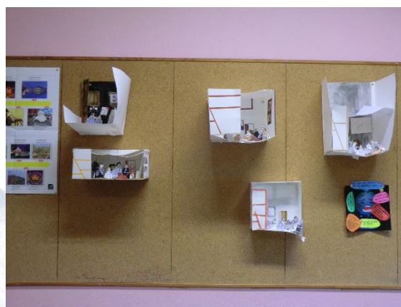
EXPO MOBILE EN DIVERS SALLES AVEC AFFICHAGE EN LIEN A D'AUTRES DISCIPLINES, CLG A. KAHN DE CHATEAUMEILLANT (CHER)